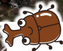
←腐りかけた松の丸太の中に カブトムシの幼虫が!(^^)!