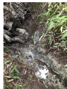
↑腐った水 がしみだして きます