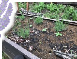
←ラベンダーも順 調に育っています